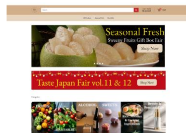
▲12/1 にリニューアルした TFD サイト

WeAgri はこれまで、現地小売チェーンとの連携、フェアの開催、現地リアル店舗の運営などを通じて、アジア市場における日本食品の販路を拡大してきました。現地の購買スタイルや嗜好への深い理解、SNS やインフルエンサーを活用した PR など多様なノウハウを有しており、自社 EC「TFD」の運用実績にも裏打ちされた、リアル・Web 連動のマーケティング実績も大きな強みです。 https://tokyofreshdirect.com/