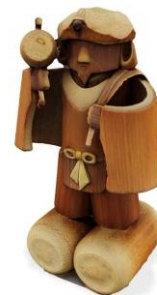
▲生成した伝統工芸品「越前竹人形」の3Dモデル。竹の質感など細部まで再現されている。

https://www.techfirm-hd.com/pressrelease/20211125.html