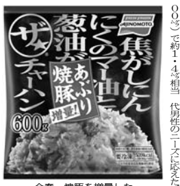
今春、焼豚を増量した

味の素冷凍食品は、健康のため塩分を減らした「五目炒飯」を開発した。塩分40%カットを実現した「五目炒飯」は、お家で手軽に楽しめる炒飯として、市場に定着していった。また、発売20周年を迎えた「本格炒め炒飯」は、今年も引き続き、市場をリードする見込みだ。