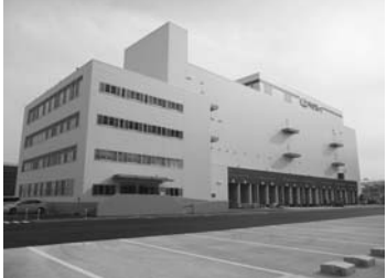
冷蔵倉庫部分は免震構造、地上4階建て

ニチレイロジの冷蔵倉庫は、免震構造で地上4階建て。冷蔵倉庫部分は免震構造、地上4階建て。 ニチレイロジの冷蔵倉庫は、免震構造で地上4階建て。冷蔵倉庫部分は免震構造、地上4階建て。