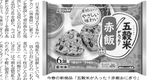
今春の新商品「五穀米が入った！赤飯おにぎり」

「ごもごもち」は、お家で手軽に楽しめる食品として、市場に定着していった。また、発売20周年を迎えた「本格炒め炒飯」は、今年も引き続き、市場をリードする見込みだ。