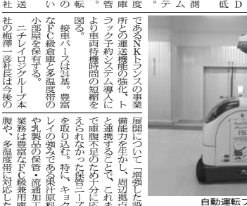
自動運転フォークリフト

ニチレイロジの冷蔵倉庫は、免震構造で地上4階建て。冷蔵倉庫部分は免震構造、地上4階建て。 ニチレイロジの冷蔵倉庫は、免震構造で地上4階建て。冷蔵倉庫部分は免震構造、地上4階建て。