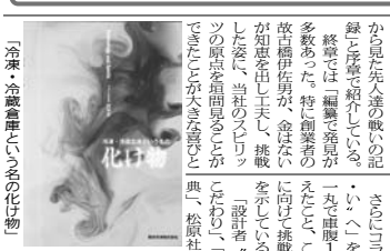
冷凍・冷蔵倉庫の自動化

本物が再現できる。本物が再現できる。本物が再現できる。 本物が再現できる。本物が再現できる。本物が再現できる。