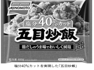
塩分40%カットを実現した「五目炒飯」

釜炊きで米の中まで味浸透 味の素冷凍食品は、健康のため塩分を減らした「五目炒飯」を開発した。塩分40%カットを実現した「五目炒飯」は、お家で手軽に楽しめる炒飯として、市場に定着していった。また、発売20周年を迎えた「本格炒め炒飯」は、今年も引き続き、市場をリードする見込みだ。